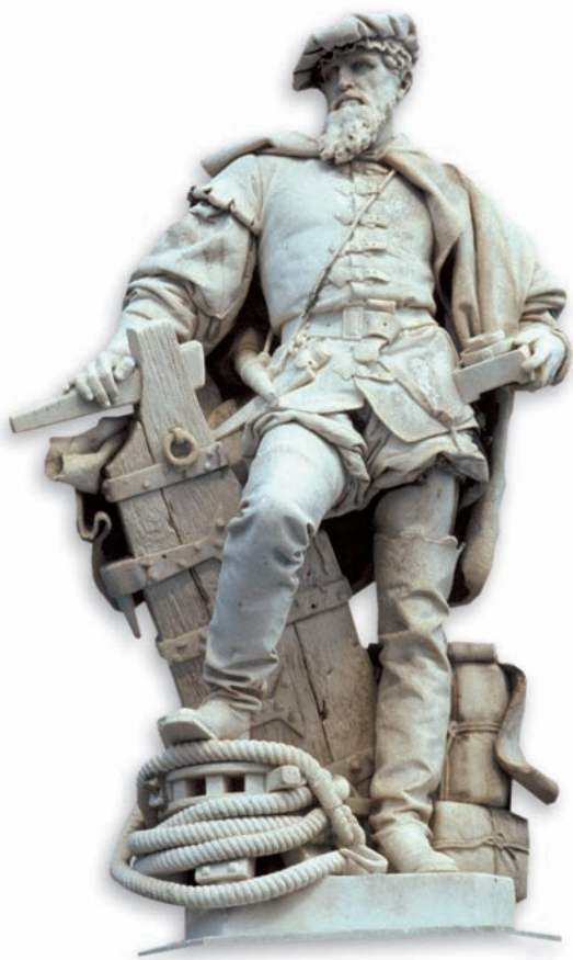
Juan Sebastián Elcano